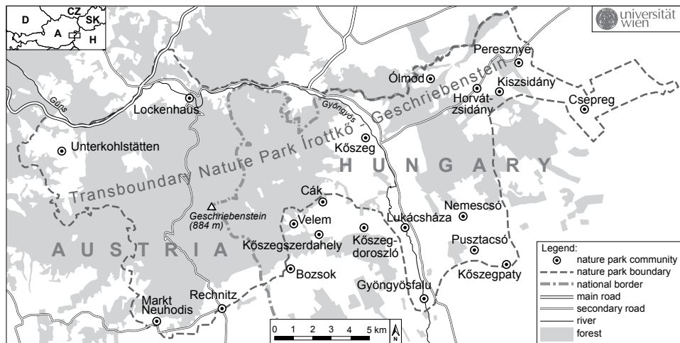
Abb. 2: Der Transboundary Nature Park Írottkő-Geschriebenstein

Auf ungarischer Seite liegt mit 27.000 Hektar der größere Teil des Naturparks. Er umfasst rund um die Stadt Güns/Kőszeg das Gebiet mit den Gemeinden Bozsok, Cák, Csepreg, Kőszegdorozsló, Kőszegszerdahely und Velem. Auf österreichischer Seite erstreckt sich der Naturpark über eine Fläche von 8.500 Hektar und beinhaltet die Gemeinden Lockenhaus, Unterkohlstätten, Markt Neuhodis, Rechnitz und Gyöngyösfa.